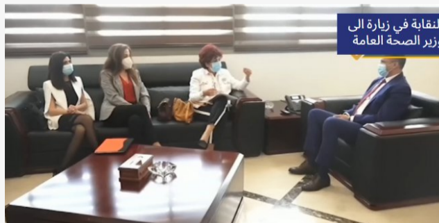
النقابة في زيارة إلى وزير الصحة العامة

لم توفر النقيبة مناسبة أو زيارة لمسؤولين للمطالبة والتذكير بحقوق الممرضات والممرضين وخاصة أن الأوضاع المهنية تدهورت نحو الأسوأ ابتداءً من 17 تشرين 2019 مروراً بالوضع الاقتصادي وانخفاض قيمة الرواتب باليرة اللبنانية. فبعد أن زارت كل من فخامة رئيس الجمهورية ودولة رئيس مجلس النواب ودولة رئيس الوزراء وحملت إليهم مطالب التمريض، وبعد أن شاركت في اللقاءات التي دعت إليها لجنة الصحة النيابية حيث أعلنت حالة طوارئ تمريضية، أرسلت النقيبة عدة كتب إلى نقابة اصحاب المستشفيات الخاصة ووزارة الصحة العامة ووزارة العمل لوضع حدّ للاجراءات التعسفية وقد أرفقت الكتب بلانحة المستشفيات والمخالفات التي ارتكبتها