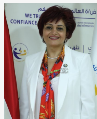
نقيبة الممرضات والممرضين د. ميرنا أبي عبدالله ضومط

لم أجد الكلمات المناسبة التي تعبر عن شعوري تجاهكم وفخري بكم وبكل فرد منكم وعن اعتزازي بالمهام التي تسلمتها كنييبة على مدى السنوات الثلاث الماضية أتوجه إليكم بالتحية والتقدير على شجاعتكم وتفانيكم والتزامكم بالمهنة ومبادئها، فكلمة حق تقال أنه لولا جهودكم ووجودكم الفاعل لما استطعنا أن نكون حاضرين على طاولة القرار الصحي في أصعب الظروف التي عصفت بالعالم بأسره وجعلته فريسة للوباء وأصبح الناس والمجتمع بحاجة إلى حماية من المرض والموت وكنتم أنتم السبيل إلى النجاة قاومتم في الصفوف الأمامية وضحيتم وخسرتم زملاء لكم ولم تستسلموا ولم تتراجعوا، ونسال الله أن يحميكم ويشد عزيمتكم فتتجلى الغيوم السوداء وتتحسر الأزمة وتنتصر سالمين التزمتم بالمهنة في ظل الظروف الإستثنائية الطارئة التي لم تشهدها البشرية منذ قرن من الزمن، لم تتخلوا عن مسؤولياتكم، فحضتم الحرب الصحية مرفوعي الرأس رغم غياب وسائل الصمود المادية واللوجستية. مما لا شك فيه بأنكم دخلتم التاريخ من الباب العريض وستسجل الأجيال القادمة لكم تضحياتكم التي أنقذت المجتمع اللبناني من كارثة إنسانية